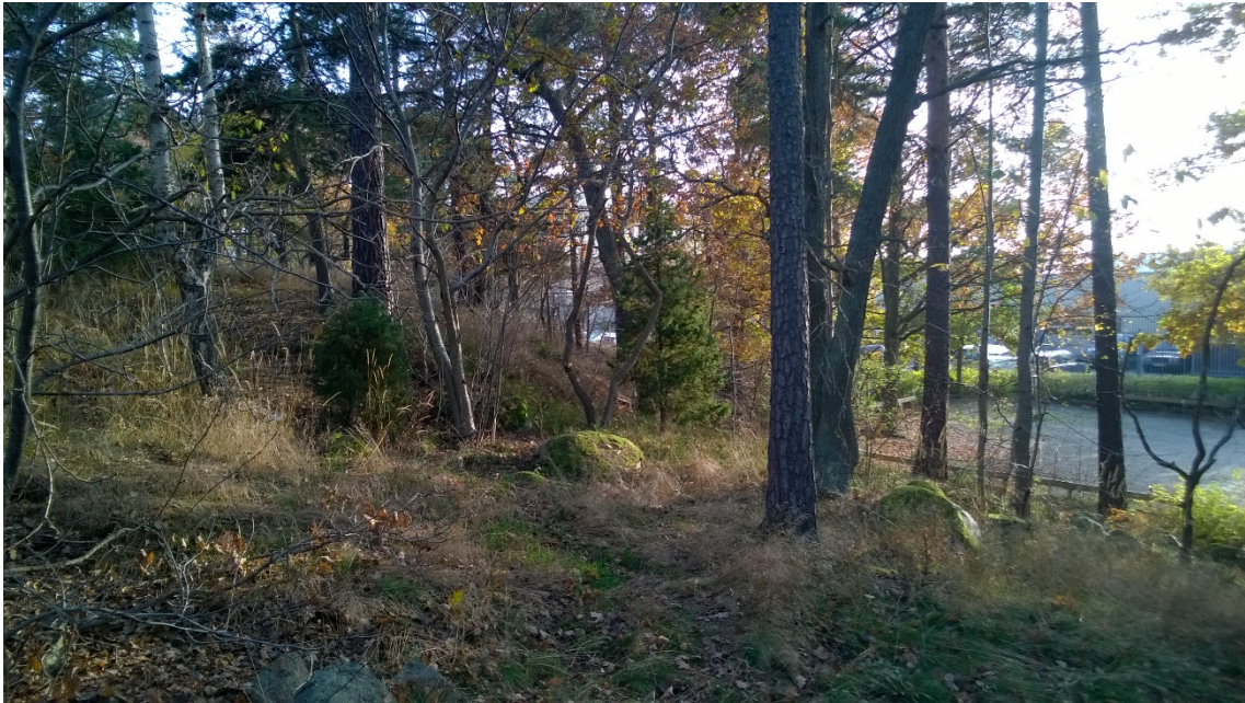
Figur 2 Glest skog med uppvuxna tallar.

Gles tallskog med inslag av ek (Figur 2). Området är del av ett smalt stråk som bildar ett grönt stråk mellan bostäder och industriområdet intill (Fasth 2013). Området utgör en värdefull spridningskorridor för arter knutna till tall. Området har i en tidigare inventering bedöms vara av högt naturvärde (Fasth 2013). Området är kuperat och delvis stenig.