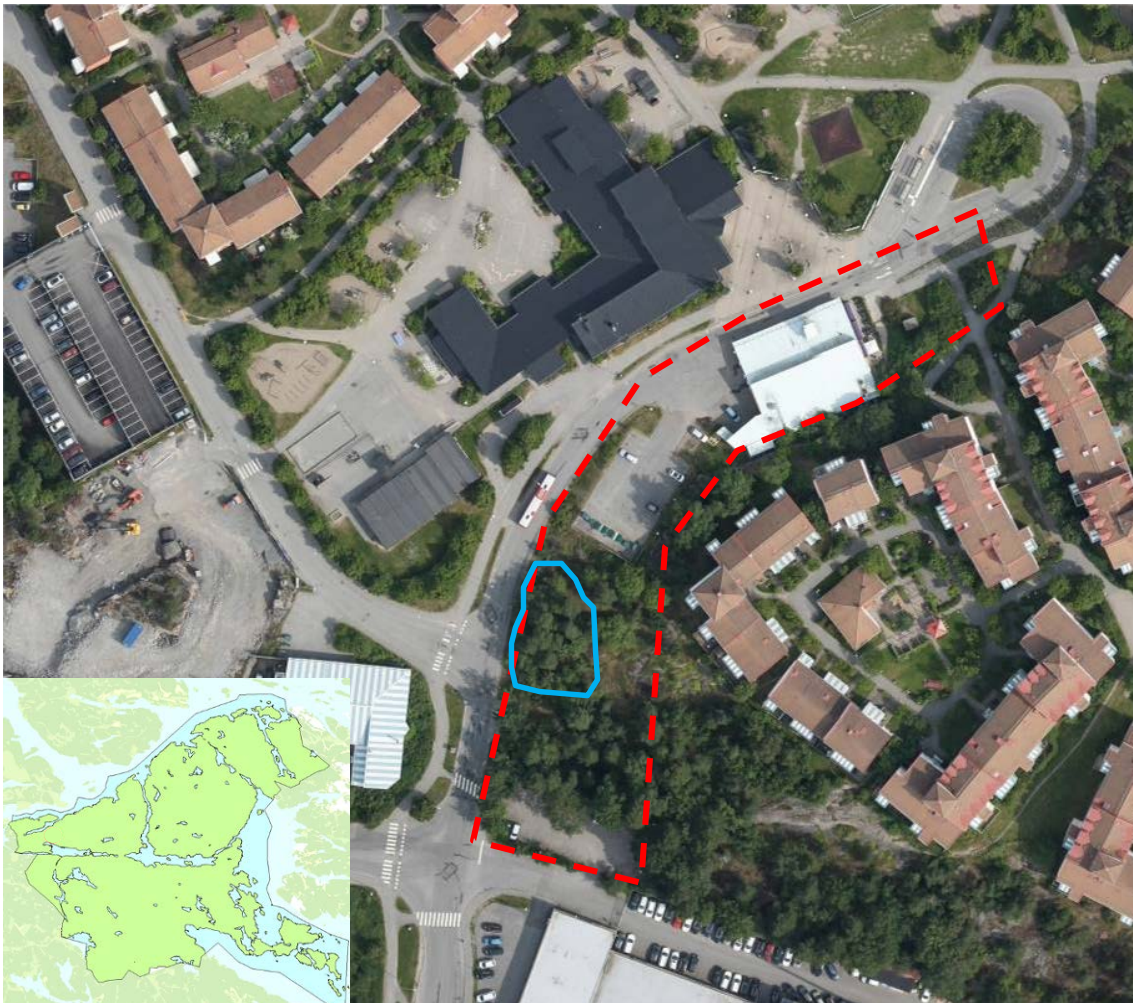
Figur 1 Planområde (rött) och grupp med äldre tallar (blått)